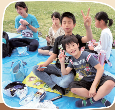
●ピクニック ●チャレンジ ゲーム大会