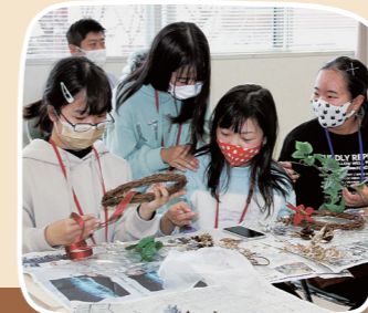
●チャレンジ ゲーム大会