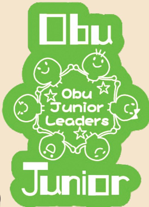
ロゴデザイン：ジュニアリーダー