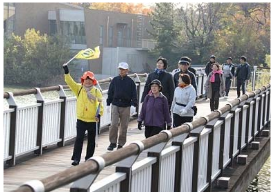
(6) 人と都市の健康増進 まち