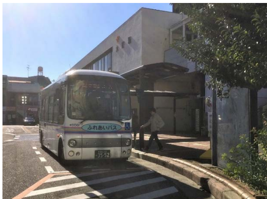
(7) 環境や景観に配慮した整備