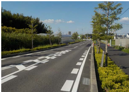
(3) 緊急輸送道路の整備