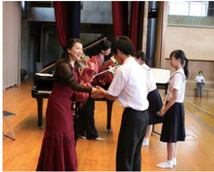
▶演奏後には、代表生徒が花束を贈りました