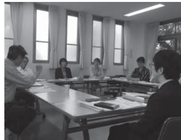
▲認知症初期集中支援チーム会議の様子