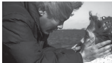
▲優秀賞 監督：浅沼直也 「冬が燃えたら」