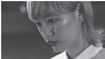
▲最優秀賞 監督：磯部鉄平 「海へ行くつもりじゃなかった」