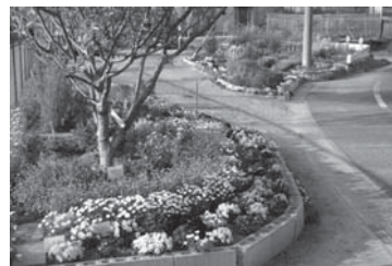
▲アダプト吉田によるガーデン