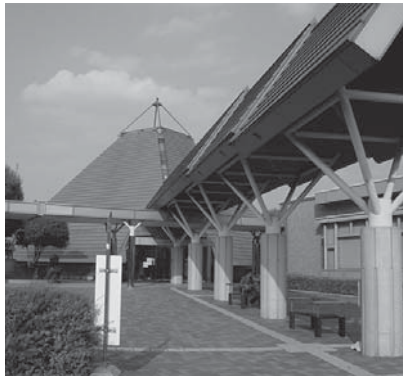
▲知多北部広域連合

ぷちトピックス ■水道の漏水に関するお問い合わせは、水道課(☎(47)2111)へ。休日などの漏水当番業者は、市ホームページでもご覧になれます。