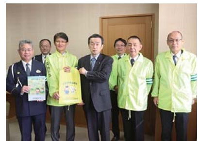
▲カバーには「くるまにちゅうい」の表記も

カバーは、遠くからでも目立つ黄色地で、車などの強い光に反射するようになっています。カバーは新1年生に配布され、安全な登下校の力強い味方となります。