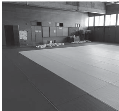
▲大府西中学校武道場