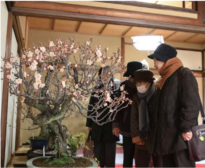
▲会場の様子 開催初日は三分咲きでした