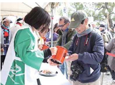
▲どぶろくの振舞いの様子