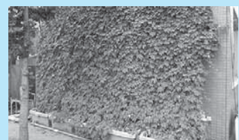
▲北山公民館エコキッズの作品