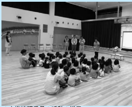
▲人権擁護委員の活動の様子