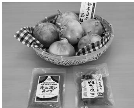
▶湯煎するだけの簡単調理