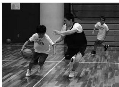
▲小学生とトップ選手との試合の様子

知多3号たまねぎは肉質がやわらかく、みずみずしいのが特徴。タマネギの甘さと食感を生かした2商品は、げんきの郷や県内一部の百貨店や道の駅などで8月末まで数量限定で販売されています。