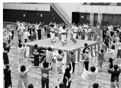
▲輪になって踊る参加者