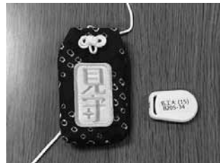
◀お守りに入れるサイズのセンサー

訓練では、10分ほどで徘徊者役を発見。名工大では、今後システムの安定性を高め、2、3年後の実用化を目指して検討を重ねるといことです。