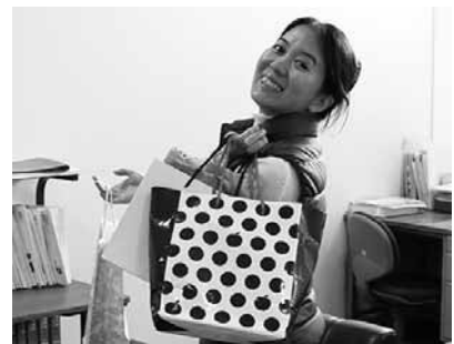
▲私も毎年、ボクシング・デーを楽しみにしています

ものごとの由来について調べることで、忘れられていた自分の国の文化を再発見することができるかもしれません。祝日やお正月などの伝統的な行事を過ごすときなどに、その日のことを調べてみてはいかがでしょうか。