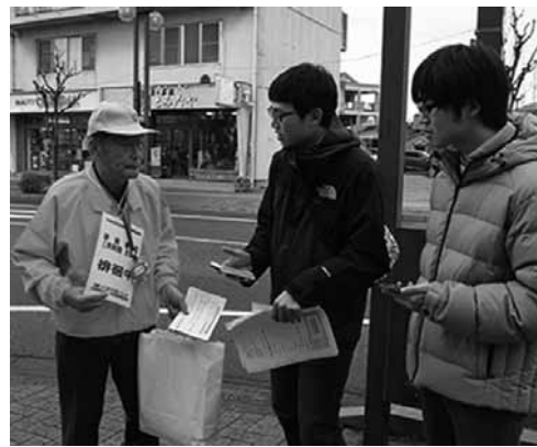
▲「見守りプラス」で徘徊者役を発見した学生