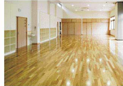
ふれ愛ゾーン(多目的ルーム)