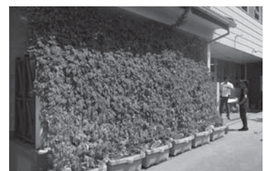
▲北山児童センターの緑のカーテン