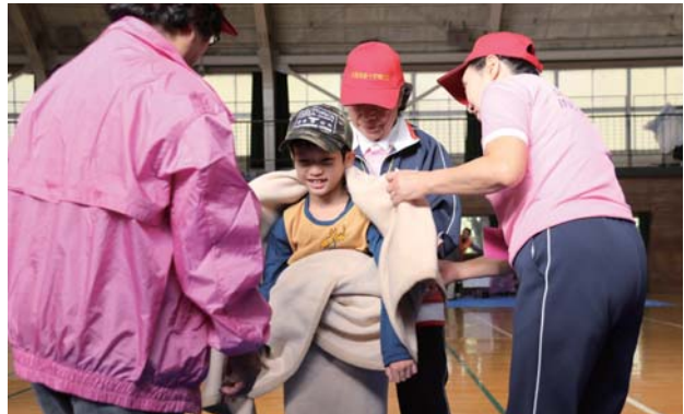
◀毛布を衣服のようにして身にまとう体験をしている男の子。