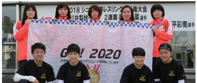
▲大府ロケットーズから選手の皆さんに東京オリンピックに向けた市民の皆さんの思いが詰まった「おおぶ市民応援フラッグ」が贈呈されました。