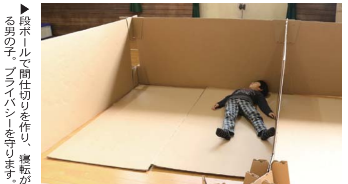
▶段ボールで間仕切りを作り、寝転がる男の子。プライバシーを守ります。