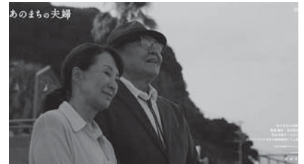
▲津田寛治監督映画 「あのまちの夫婦」