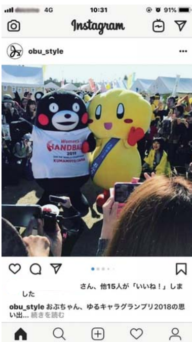
▲スマートフォン画面

市では、市公式Instagramのアカウントを開設しました。大府市の魅力を写真、動画で全国、世界に発信します。