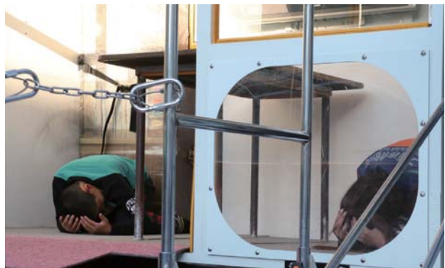
◀地震体験車で、震度7の揺れを体験する男の子。