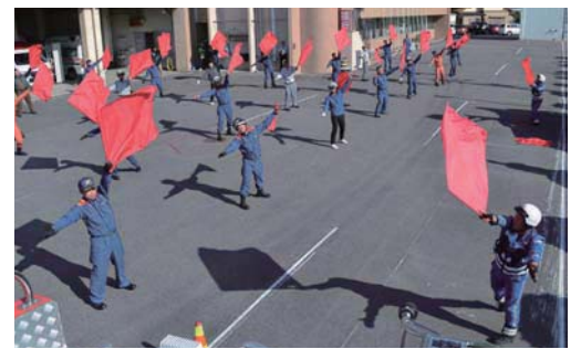
▲市消防職員が並んで旗振りの訓練をしました

27日、市消防本部で中日本ハイウェイ・パトロール隊員を講師とした安全講習訓練が行われました。高速道路での救助活動は、隊員が二次災害に巻き込まれる危険性があり、安全対策の手法や赤旗の振り方、走行車線規制方法などを学びました。市消防本部では、これらの手法を一般道路でも生かしていくとのことです。