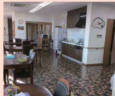
▲通所利用者が日中過ごすスペース

訪問などから徐々に慣れ、通いや泊まりにつなげるなど、サービスの組み合わせは本人の状況に合わせて行います。在宅と施設の間のステップとしての利用ができます。