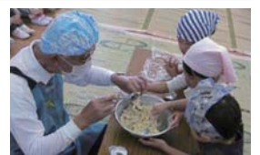
▲地域の方と鬼まんじゅう作りをしている様子