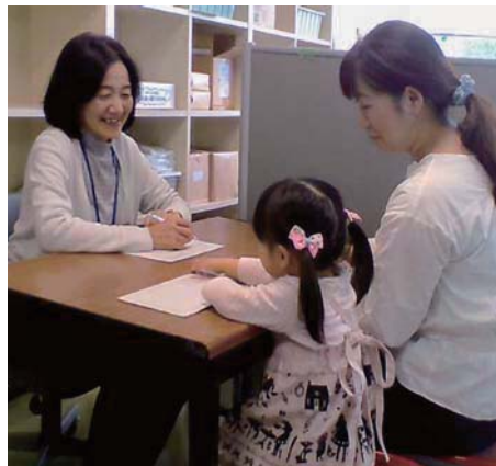
▲ことばの相談の様子