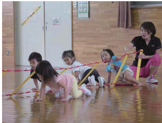
▲体力向上プロジェクトの様子

平成29年度から重点的に取り組んでいる子育て支援施策「子ども・子育て八策」を充実します。今年度は、子どもの運動能力向上のための「体力向上プロジェクト・運動遊び講座」を市内全ての児童老人福祉センター(児童センター)で実施し、跳び箱やロイター板を新調することにより、保育園での体力づくりを推進します。