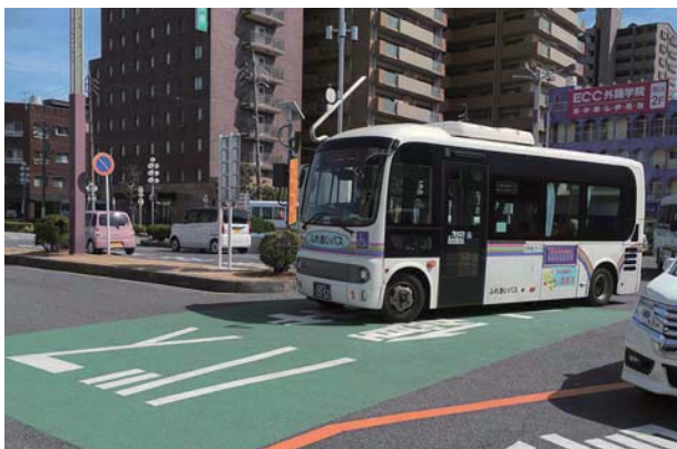
▲大府駅前を走る循環バス

大府駅東側には、民間活力の活用により、自動車と自転車の立体駐車場と生活サービス施設の複合施設を整備し、にぎわいの創出を図ります。