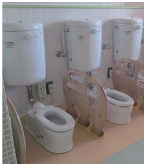
▲保育園の洋式トイレ