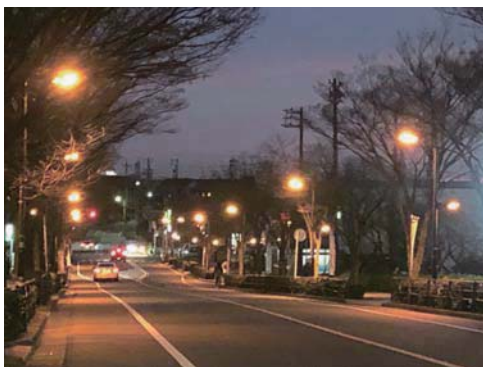
▲大府駅周辺の道路照明灯

先進的な省エネ改修手法(ESCO事業)を活用し、今年度中に市内の全ての道路照明灯のLED化を実施します。また、防犯灯もLED化を推進し、電気料金と環境負荷の軽減を図ります。