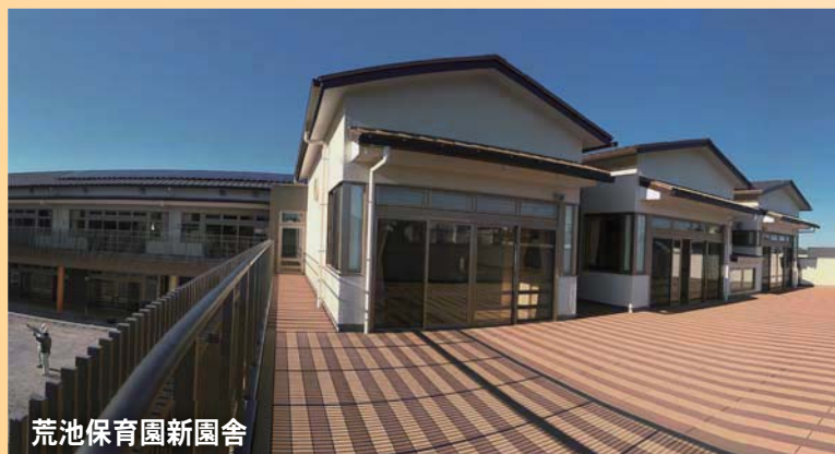
荒池保育園新園舎