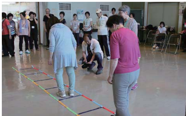
▲健康長寿塾の様子

国立長寿医療研究センターと連携し、フレイル(虚弱)予防のための「プラチナ長寿健診」の実施、認知機能の維持・向上に役立つ「コグニサイズ」の普及や介護予防のための「健康長寿塾」の開催など、先進的な取り組みを展開し、高齢者の元気を応援します。