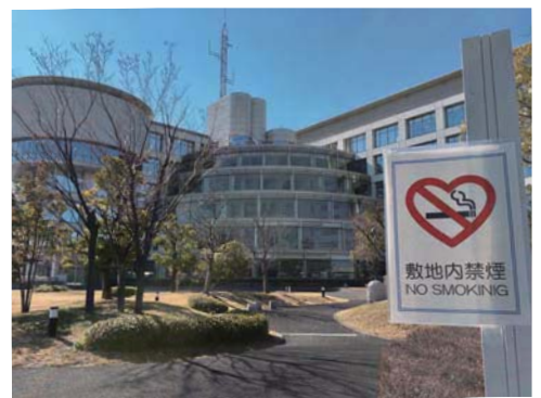
▲4月から敷地内禁煙の市役所

市内公共施設における敷地内禁煙、屋内禁煙を積極的に推進するとともに、公園における啓発を行い、たばこの煙による受動喫煙の防止に努めます。また、禁煙外来治療に係る費用を助成し、市民の禁煙の取り組みを後押しします。