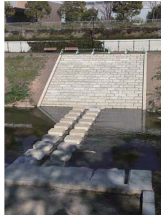
▲鞍流瀬川に設置した飛び石

鞍流瀬川、矢戸川沿いに緑道を整備し、新池(若草町)の護岸には張出遊歩道を新設します。また、川池(若草町)は、市民ワークショップの案を基にした親水空間の整備工事を行います。また、辰池(神田町)では、地域の憩いの場整備のため、用地を取得します。さらに、ウォーキングマップを作成し、誰もが歩きたくなる環境の整備を進めます。