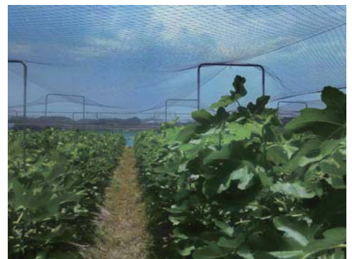
▲鳥獣被害防止用ネットを設置した畑

農業用機械購入や施設整備、既存施設の更新・修繕に係る経費を助成することにより、新たに農業を始める方を応援します。また、果樹の生産・販売を行う農家に対して、鳥獣被害を防止するネットなどの設置に係る費用を助成し、農業の多様な担い手を支援します。