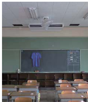
▲設置した空調の室内機

平成31年の夏までに、市内全ての小・中学校および特別支援教室にエアコンを設置し、暑から子どもを守り、快適な学校生活の環境整備に取り組みます。