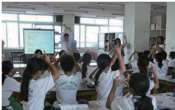
▲認知症サポーター養成講座の様子

市民や関係機関と一体となって、平成32年度までに2万人の認知症サポーターを養成する「認知症サポーター養成2万人チャレンジ」を昨年に引き続き実施し、認知症に対する不安のないまちづくりをさらに推進します。