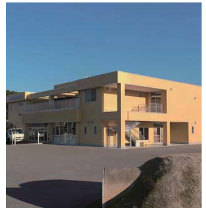
▲大府大和共栄保育園

民間事業者と連携して平成31年4月に認可保育所定員を534人拡大し、平成32年4月に向けて新たな民間保育所の開所を目指した誘致を進めます。また、認可外保育施設を認可化するための支援を行い、保育所定員をさらに拡大するとともに、人口増加や幼児教育・保育の無償化による保育需要の高まりに対応します。