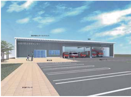
▲完成予定図(明成町)

共長出張所の新築移転および新たな防災学習の拠点となる体験型の防災学習センターの建設工事を実施し、消防拠点施設の充実と消防力の強化を図ります。また、被災者支援システムと市町村防災支援システムを導入し、大規模災害に備えます。