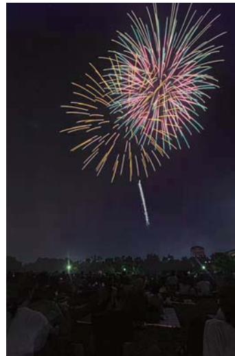
▲大府東浦花火大会の様子

あいち健康の森周辺に集積しているウェルネスバレー関係機関や東浦町と連携し、医療・福祉機器などの開発や事業化を支援します。また、あいち健康の森公園で行われる「大府東浦花火大会」を主催する実行委員会に補助金を交付して開催を支援します。