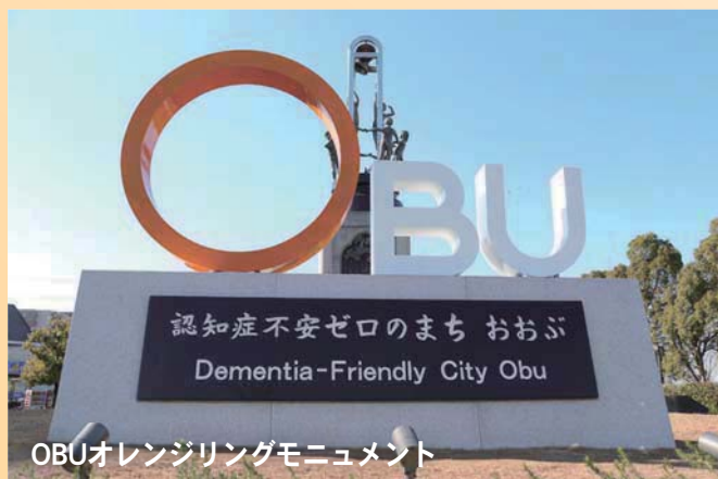
Obuオレンジリングモニュメント