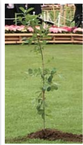
お手植えをされたヒトツバタゴ