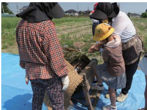
▶ 児童に脱穀を教える菜の花クラブ会員

小学校での授業の他にも、廃油からせっけんを作るイベントを開催するなど、体験を伴う環境学習を多く実施している菜の花クラブの皆さん。今後も循環型社会形成の大切さを広く伝えていくため、活動が続けます。