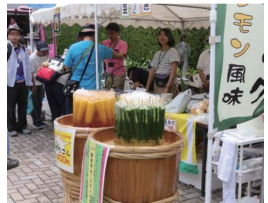
▲競馬場内で大府物産展を開催