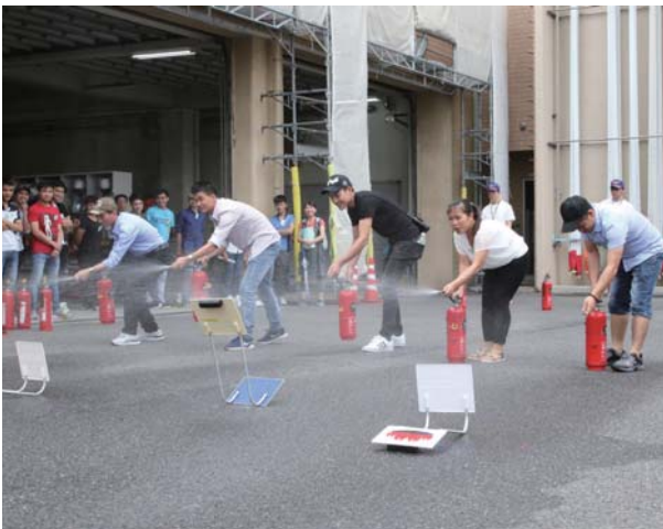
▼消火訓練を行う参加者