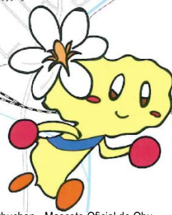
Obuchan - Mascote Oficial de Obu - おぶちゃん