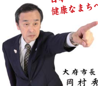
大府市長 岡村 秀人