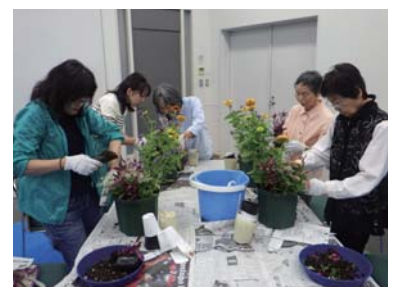
▲前回の交流会の様子