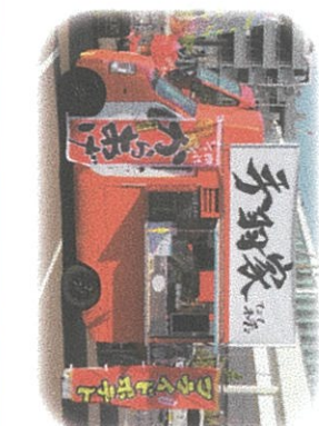
インドカレーヒヤラヤは土・日・祝のみ出店