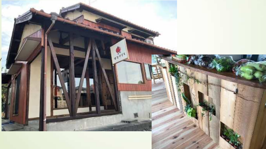
6次産業化の促進（農家カフェ「はたけぞく」）

駅周辺のにぎわい創出と商業・工業・農業の振興 による活力ある豊かな市民生活の基盤づくり