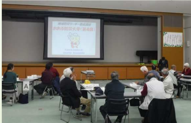
地域防災リーダー養成講座 「おおぶ防災大学」の実施