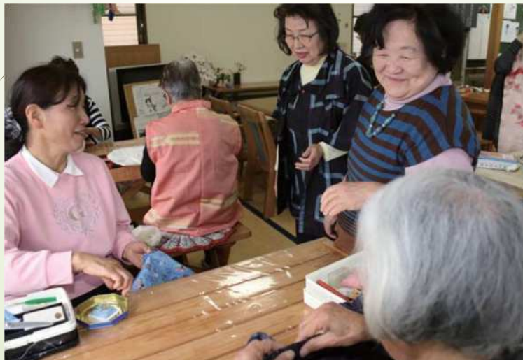
常設サロン「ふれあいの居場所みどり」の様子（江端町）