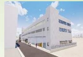
大府駅東立体駐車場・ 駐輪場イメージ