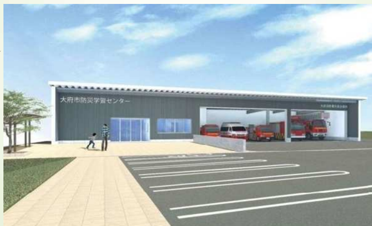
消防署共長出張所の新築移転に併せた 防災学習センター設置を計画