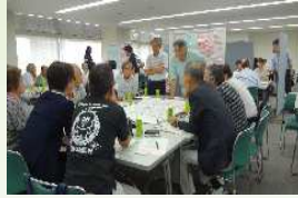
第4次大府市都市計画マスタープランの策定（地域別ワークショップの様子）