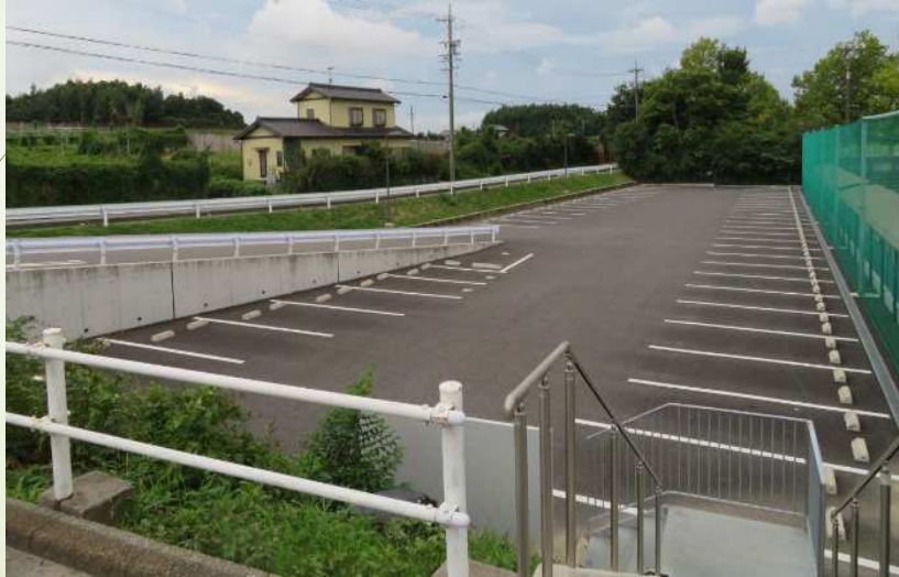
大府体育センターの駐車場拡張