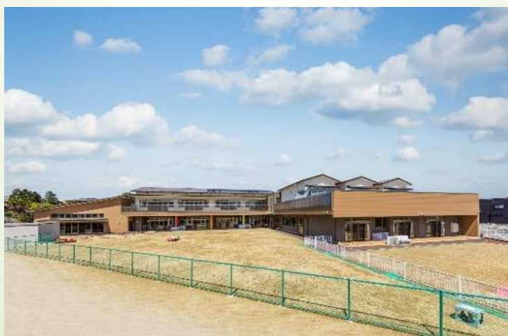
新しくなった市立荒池保育園

大府市子ども・子育て応援基金を新設し、 「おおぶ子ども・子育て八策」を精力的に推進