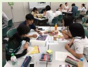
（仮称）若者会議イメージ