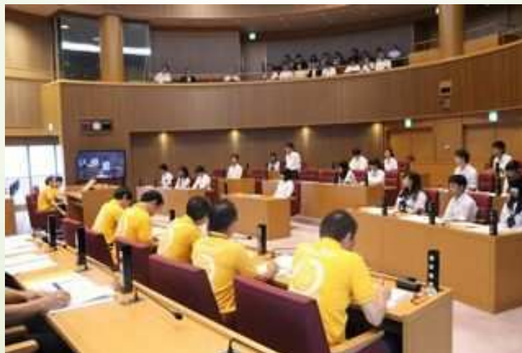
高校生議会の開催