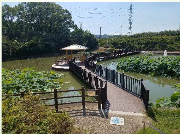
星名池（北崎町）の景観整備