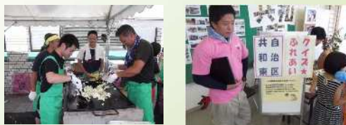
地域で活動する市職員