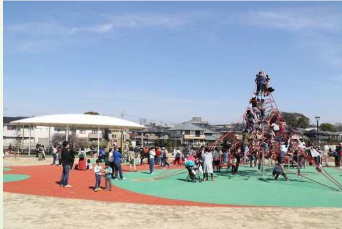
ハツ屋大池公園の設置 (共和西土地区画整理事業区域内)