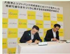
ソフトバンクとの「ICTの活用による持続可能なまちづくり」に関する包括連携協定