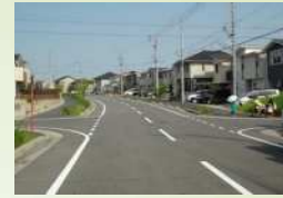
土地区画整理事業による良好な住環境