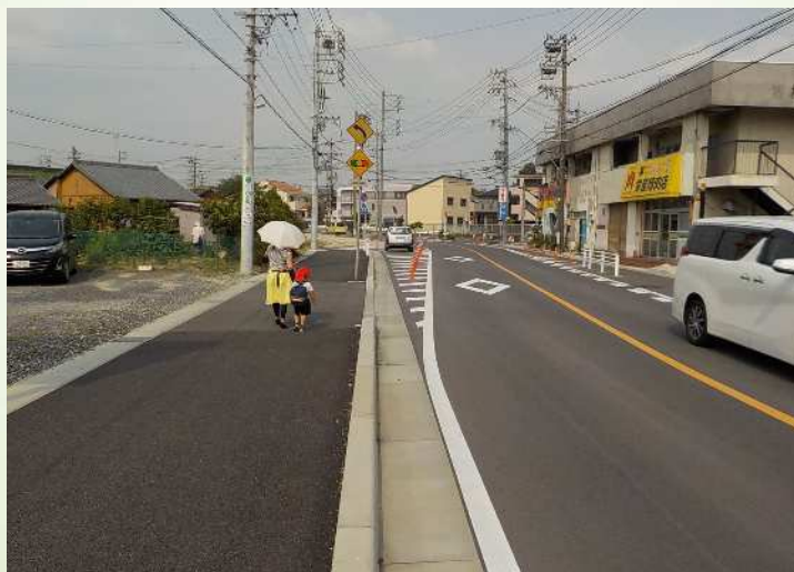
市道共和駅東線などの道路事業を推進