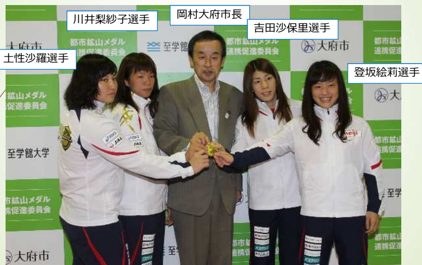
都市鉱山から作る！みんなのメダルプロジェクト