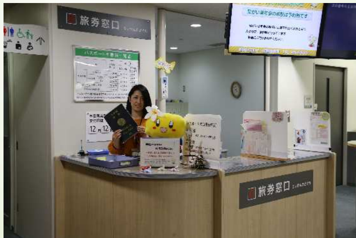
市役所でのパスポートの申請・交付