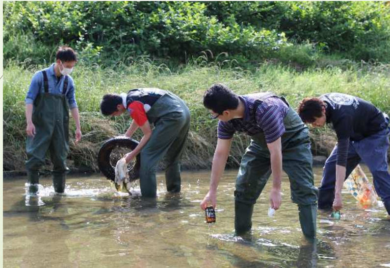
職員と市民との協働による河川清掃の実施