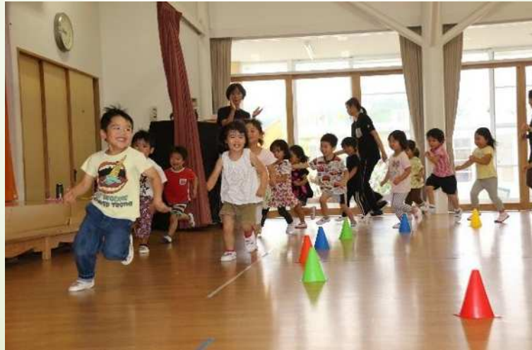
大府市運動遊びプログラム実践の様子

大府市子ども・子育て応援基金を新設し、 「おおぶ子ども・子育て八策」を精力的に推進