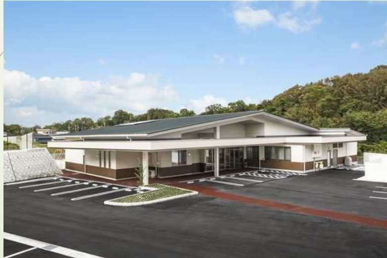
大府市発達支援センターみのり