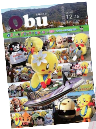
▲平成30年12月15日号表紙 ▶平成26年3月1日号表紙