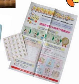
▲市民健康カレンダーのシールとしておぶちゃんが登場