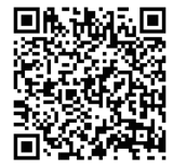
Ilustração : Kengo Morita