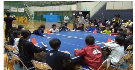
4面卓球バレー体験

4面卓球バレー体験はスポーツ推進委員がお手伝いします。 ご希望の方はスポーツ推進課までお問い合わせください。