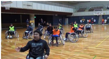
車いすバスケットボール体験