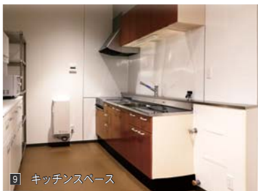
9 キッチンスペース

1 旧共長出張所から約850 ㎡ 南に移転。敷地面積は約5.5倍、床面積は約1.7倍の施設に生まれ変わりました 2 省スペース化のため、事務室・食堂・ミーティングルームを一体化。席を固定しないフレキシブルオフィススタイルの事務机を採用 3 指令モニターを設置し、防火衣に着替えながら情報共有が可能に 4 救急活動後の資機材の洗浄などを行います 5 1階が倉庫、2階がマンションの1室を模した作りになっており、はしごを使った救助訓練や2階建て家屋への放水訓練、屋上によって高所からの救助訓練などができます 6 7 男性用9部屋、女性用1部屋の全個室。各部屋に放送用スピーカーを設置し、仮眠中の出勤要請にも迅速に対応できます 8 懸垂バーやトレーニング機材を整備。救急訓練にも活用できます 9 男性職員の利用を考え、キッチン台の高さを高くするなど男性目線を取り入れたキッチンスタイルを採用