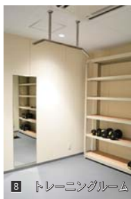
8 トレーニングルーム