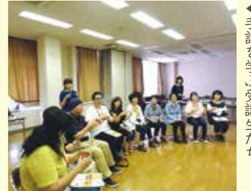
しゅわ まな じゆこうせい 手話を学び受講生たち

ちようかくしやう しゅわ かん きそてき ちしき まな 聴覚障がいや手話に関する基礎的な知識について学び、 ちようかくしやう しゃ しゃかいさんか しえん しゅわほうしん しょうせい ころざ かりやう 聴覚障がい者の社会参加を支援する手話奉仕員を養成する講座です。(無料) ば しょ おおぶししゃかいふくしきやうぎかい 場所…大府市社会福祉協議会(TEL: 0562-48-1805)