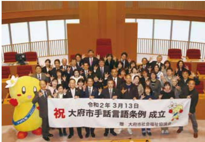
れいわ ねん がつ にちしこう さつえい ※令和2年3月13日議場にて撮影