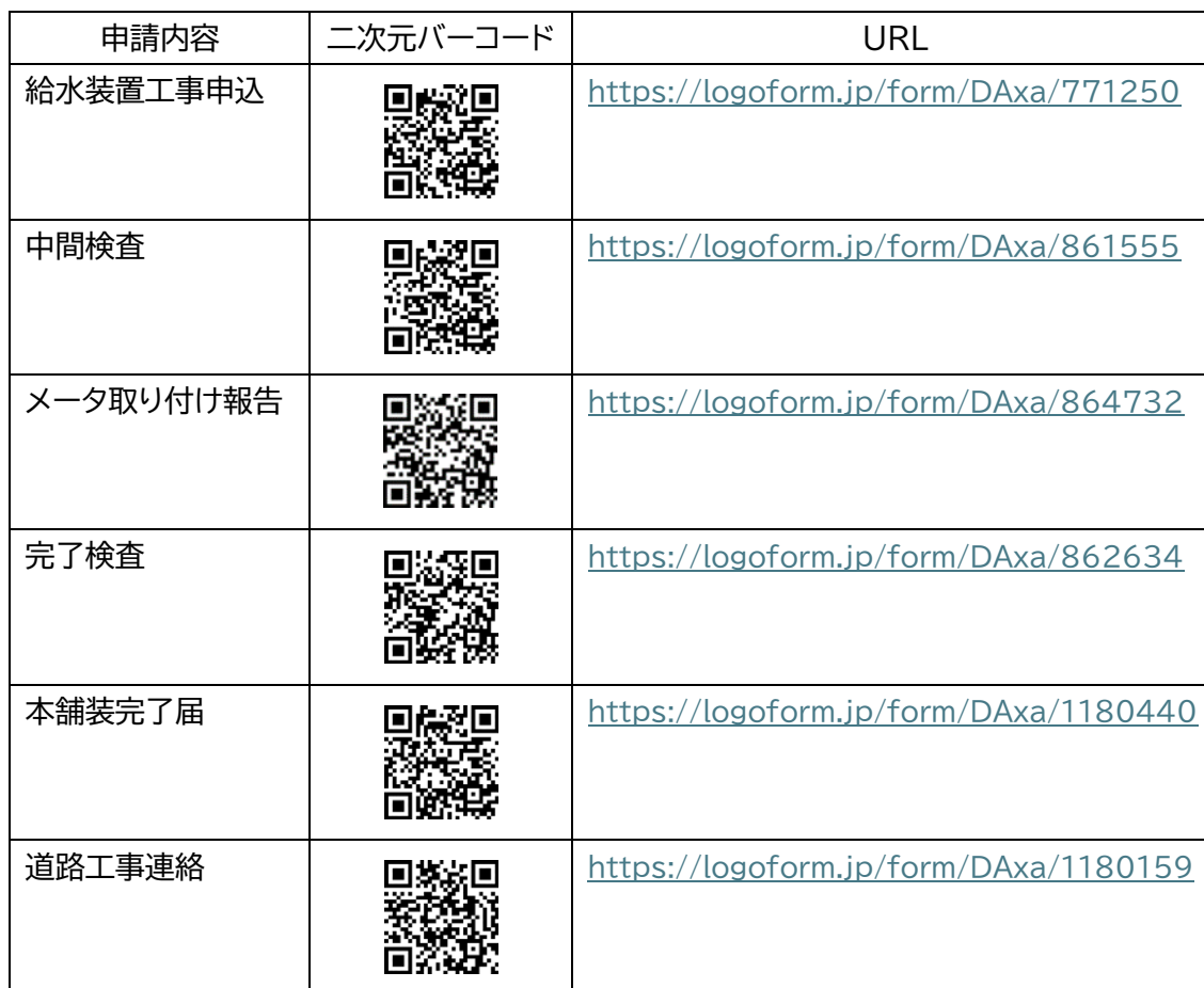
表1:各種申請の二次元バーコード・URL 一覧