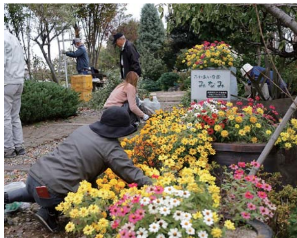
▼ドーム菊を鉢上げする吉田まちづくり協議会緑花部のメンバー

水槽は昇降口前の環境コーナーに設置され、令和3年3月末まで貸し出される予定です。