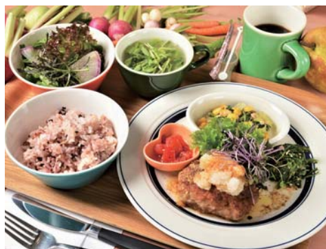
▲週替わりランチプレート 990円(税込)

ランチメニュー(11:00~15:00)の一番人気、『週替わりプレート』(税込990円)。メインのお肉料理に、ミニサラダ、野菜のデリ2種、十八穀ご飯、スープ、ドリンクが付いて、ヘルシーなのにボリューム満点です。こちらのメインをごはんの上にのせた、テイクアウトの『KURUTO丼』(税込600円)もオススメです。お店でも、おうちでも、ぜひKURUTOおおぶの料理をお楽しみください。