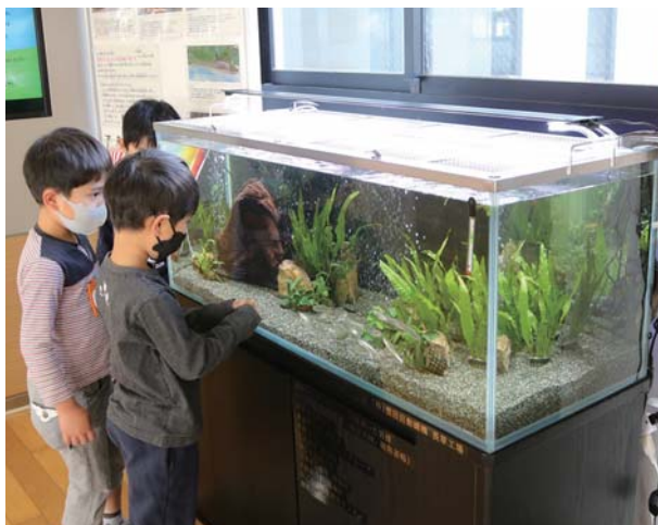
▼食い入るように水槽をのぞき込む児童ら