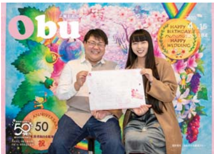
▲撮影用記念パネルの前で笑顔を見せる新婚夫婦

12月24日、未来への一歩を踏み出す新郎新婦の門出を祝う、『届け出挙式』が市役所の議場で行われる予定。