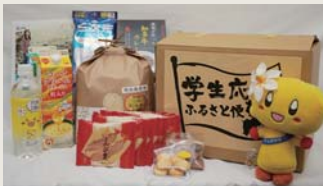
▲ふるさと便の送付品

ちゃんにも一律10万円を支給する市独自の「臨時特別出産祝金」については、新聞や昼の情報番組で取り上げられ、全国から注目が集まり、大府に追随する自治体も多く見られた。