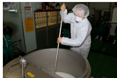
醸造参加（岡村市長）