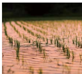
#田植えと夕焼け #幻想的な光景にうっとり