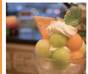
#メロンパフェ登場 #色合いがキュンです