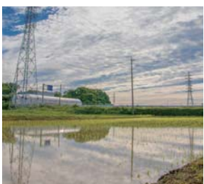
#雄大なリフレクション #田んぼと青空のコラボ