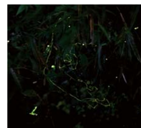
#ほたるの里 #乱れ舞うホタル