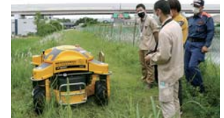
▲業者から操作方法を学ぶ職員ら

口無大池で、無線遠隔操作ができるラジコン型草刈り機のデモンストレーションが行われました。この草刈り機は、草刈り業務の効率化・安全性の確保などを目的に導入したもので、草刈り業務がある部署の職員らが参加しました。操作を体験した担当者は「危険が伴う法面での草刈りもできました。活用できる場面が増えそうです」と話しました。