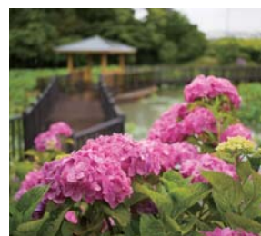
#星名池 #新しいアジサイの名所