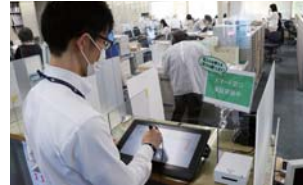
▲タッチパネルで実演する職員

市民課窓口で、転入届などの申請書を記入する負担を省くスマート窓口システムの導入に向けた実証実験が、6/24まで実施されました。この実験は、窓口での申請をデジタル化した場合の課題を発見し、本格稼働に向けたプロセスを構築することを目的としています。担当者は「実験で得られたデータをもとに、どのような手続きに活用できるかを見極めて、デジタル化の推進を目指します」と話しました。