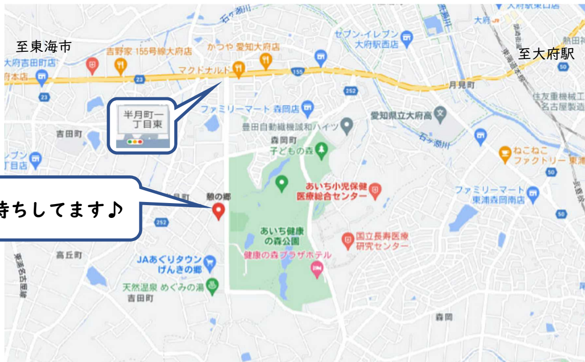
地図は Google が提供する機能で掲載しています。