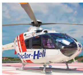
#ドクターヘリ #あいち小児保健医療総合センター