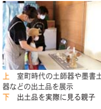
上 室町時代の土師器や墨書土器などの出土品を展示 下 出土品を実際に見る親子