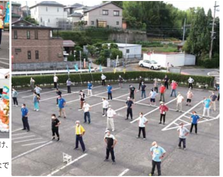
▲この日は、78人が参加しました