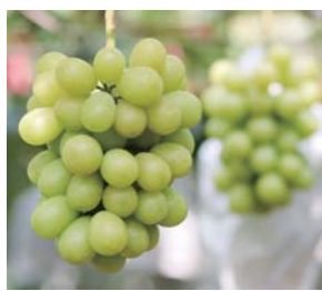
#シャインマスカット #ブドウの農業産出額県内1位