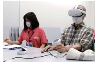
▲コントローラーを使って検査を受ける市民

市役所で、高齢ドライバーの運転技能の維持・向上に向けた取り組みの一環として、VR(※)を用いた運転技能検査が行われました。この検査はプラチナ長寿健診のオプションとして追加でき、自動車運転免許をお持ちの方が対象。VRを使って、安全確認や一時停止などが正しく行われているかを無料で検査していました。※VR=コンピューターによって作られた仮想的な世界を、現実世界のように体感できる技術。