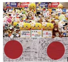
#ぬいぐるみが選手を応援 #至学館大学