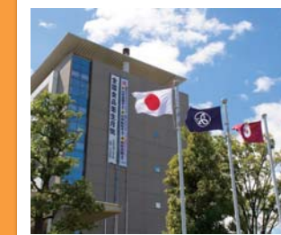
#金メダル獲得 #姉妹で金 #懸垂幕