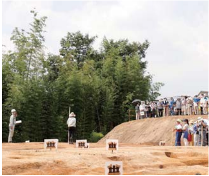
▲市内での大スcoopに多くの市民が興味津々