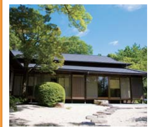
#大倉公園休憩棟 #暑いときは縁側で