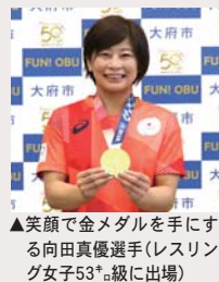
▲笑顔で金メダルを手にする向田真優選手(レスリング女子53kg級に出場)

市は、東京五輪・パラリンピック終了後も継続して、パソコンや小型家電のリサイクルを行っています。市の回収ボックスや宅配便によるパソコンの無料回収をご利用ください。詳細は、市ウェブサイトをご覧ください。