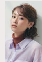
女優 柳美稀さん オスカープロモーション所属

ビデオグラファーに扮した柳美稀さんが、大府の魅力あふれる映像作品を紹介するストーリー仕立ての記念映像をYouTube「おおぶムービーチャンネル」で公開しています。ぜひご覧ください。