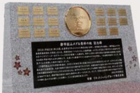
▲記念碑のメダル部分は、リサイクルされた金属を使用しています