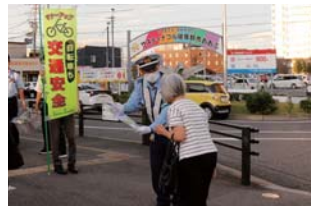
▲チラシなどが入った啓発セットを配る警察署員

県条例で10/1から自転車保険の加入が義務化され、自転車利用者のヘルメットの着用が努力義務となることを受け、市職員と東海警察署員らが、JR共和駅で通行人に啓発しました。この条例は、自転車利用者が加害者となる交通事故により、高額の損害賠償を請求される事例が発生している現状を踏まえ、被害者救済を目指すために県が制定したものです。