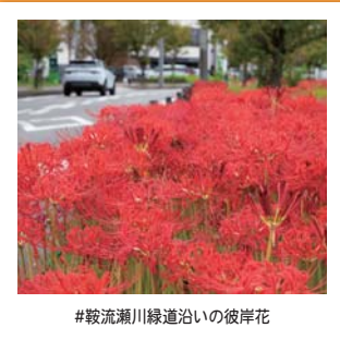
#鞍瀨瀬川緑道沿いの彼岸花