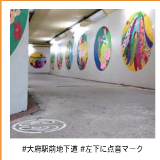
#大府駅前地下道 #左下に点音マーク