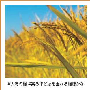
#大府の稲 #実るほど頭を垂れる稲穂かな