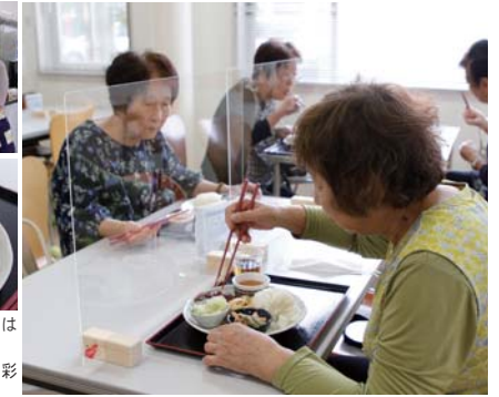
▲感染対策を万全に、ランチを楽しむ利用者