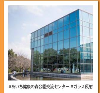
#あいち健康の森公園交流センター #ガラス反射