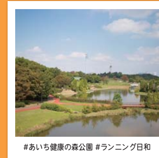
#あいち健康の森公園 #ランニング日和