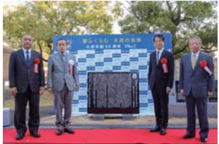
▲関係者らによる記念撮影

石碑には、市制50周年を迎えた令和2年9月1日に市長・議長・市民代表の3者により行った共同宣言が後世に引き継がれ、新たな50年に向けて持続可能なまちづくりを実現できるように、との願いが込められています。