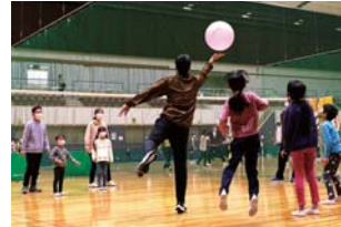
▲「風船バレー」を体験する参加者

メディアス体育館おおぶで、ニュースポーツフェスタが開催され、幼児からお年寄りまでの約150人がニュースポーツの魅力体験しました。ニュースポーツは、勝敗にこだわらず、誰もが気軽に楽しむことを重視しているのが特徴。この日は、ビーチ