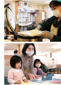
上 出来たての温かいご飯が食べられます

全世代型サロンは、「食」を通じて、子どもから高齢者まで世代を超えた地域住民同士のつながりをつくる場所です。「だんらん」は、原則毎月第1土曜日の11:00~14:00に開いており、事前申し込みなく、中学生以下の子どもは100円、大人は300円で、栄養バランスの取れたランチが食べられます。