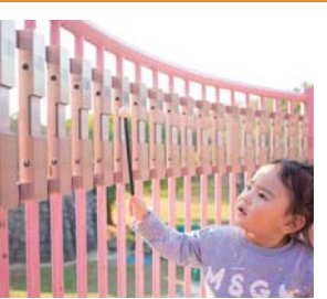
#大府みどり公園 #タやけ小こけ #鉄琴

ます。今回は、共和東自治区内の指定避難所で、ダンボールによる間仕切りの組み立てや非常用電源の確保など、避難所運営訓練が行われました。