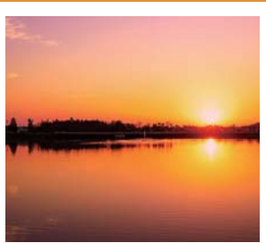
#二ツ池公園 #マジックアワー