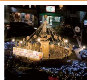
#共和駅西側 #gold17 #金メダルのまち