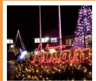
#愛三文化会館 #希望の光となるように