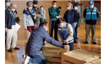
▲ダンボールベッドの組み立てを体験する参加者

東山小学校体育館で、地域総ぐるみ防災訓練が開催され、共和東自主防災会と市災害対策本部共和東支部の約50人が参加しました。この訓練は、災害に対する防災体制の確立と市民意識の高揚を図るため、地域や行政機関などが一体となって毎年実施してい