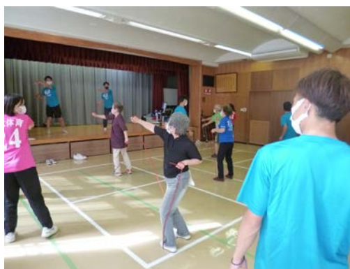
シニア健康づくり教室の様子 （神田公民館）