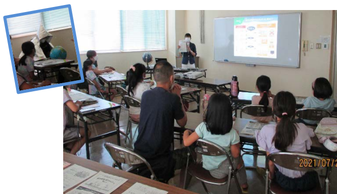
親子エコエコ探検隊～どうする？地球の明日 ストップ温暖化～の様子（吉田公民館）