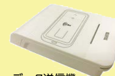
データ送信機(リーダーライター)