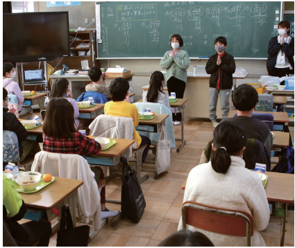
▲みんなで元氣よく「いただきます」