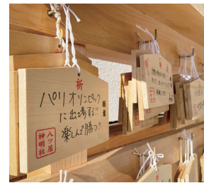
#給馬 #八ツ屋神明社