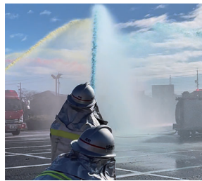
#消防出初式 #カラー放水