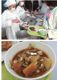
上 甘くておいしいと大好評だったみそ汁。完食しました 下 サツマイモ本来の味を楽しめるよう、みそ汁で提供