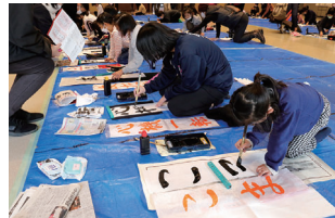
▲真剣に書き初めに挑戦する子どもたち

愛三文化会館で、3年ぶりに子ども書初め大会が開催され、市内在住の子どもたち約100人が書き初めに挑戦しました。この大会は、書き初めを通して文字・言葉に触れ、豊かな人間性を育み、日本の伝統文化を守ることを目的に開催。子どもたちは「うさぎ」「友だち」「有言実行」など、それぞれの課題語句を真剣に書き上げました。提出された作品の中から、審査により市長賞・議長賞などをはじめ、特選・秀作・佳作などが選ばれました。