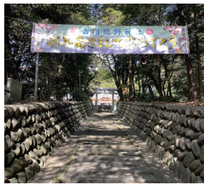
#吉川熊野神社 #初詣のおもてなし