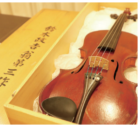
#鈴木政吉第3号バイオリン #1888年製