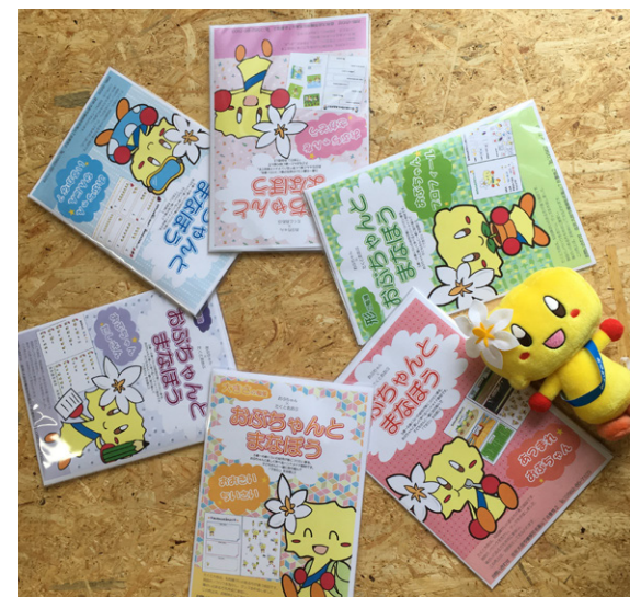
おぶちゃんの知育グッズを製作しています

大府福祉会は、ご利用者の方と職員や、職員同士の仲がとても良いです。特にご利用者の方と職員の間では、「仕事だから」という意識が出てきそうですが、そのようなことは感じません。どんな場面でも、ご利用者の方としっかり向き合おうとします。それは職員が心からご利用者の方の為に何かしたいと思っているからだだと思います。そんな素敵な雰囲気の職場で働いてみませんか。