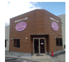
焼き菓子とパンの店 あけびの美