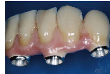
インプラント上部構造