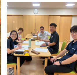
チームワークの良い職場です