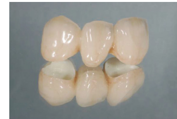
オールセラミックナゾルコニア