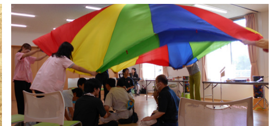
レクリエーションの様子