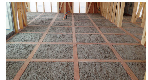
セルローズファイバー