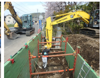
水路集水樹布設工事