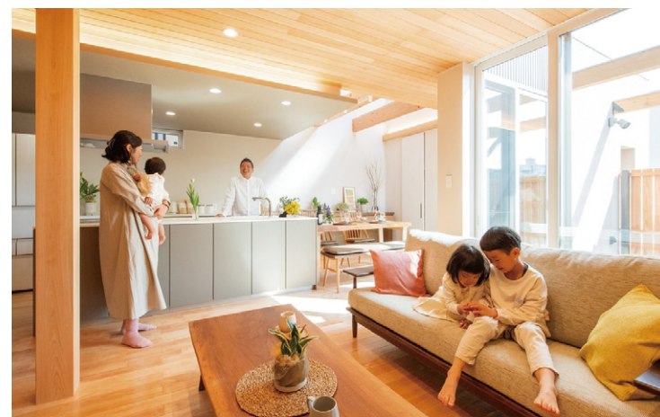
注文住宅品質をモデルハウスに注ぎ込みました

二級建築士の資格を取って入社しましたが、専門学校で得た知識では足りないことを思い知らされる日々。実戦でスキルアップ・レベルアップ! 産休・育休を経て復職もできました。(社歴13年目 女性 営業・アドバイザー)