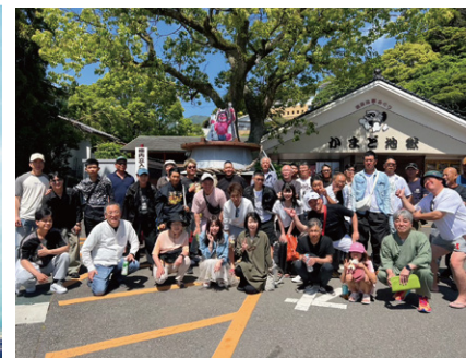
リフレッシュツアー