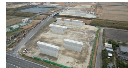
2025年 愛知県発注 西知多道路