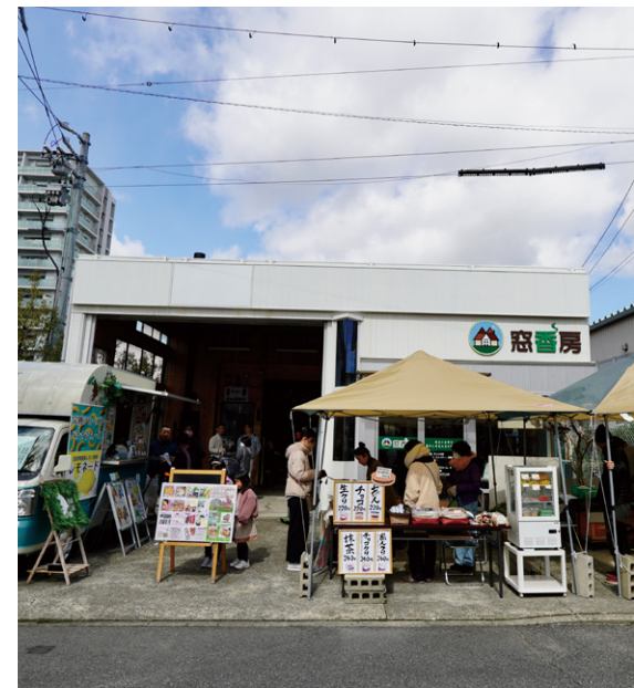
毎月第一土曜日にマルシェを開催しております。 地域の皆様とのふれあえる大切な機会です。

地域密着を念頭に地元の方々のお役に立てればと思い仕事させていただいています。 最近、建築業未経験の方が入社しましたが、毎日楽しんで仕事しています。 地域の方の為に毎日楽しく仕事しませんか?