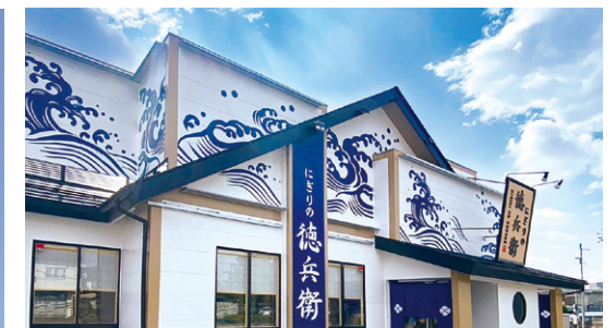
握りの徳兵衛敷島店