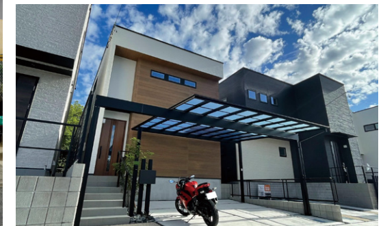
エクステリア施工も行っております