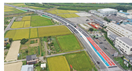
2020年完成 知多建設事務所発注 瀬戸大府東海線