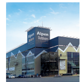
アルペンアウトドア柏店