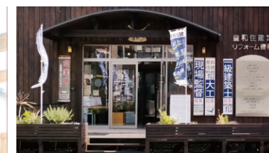
弊社ショールーム (ギャラリー豊和)