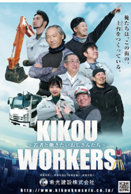
希光建設ポスター