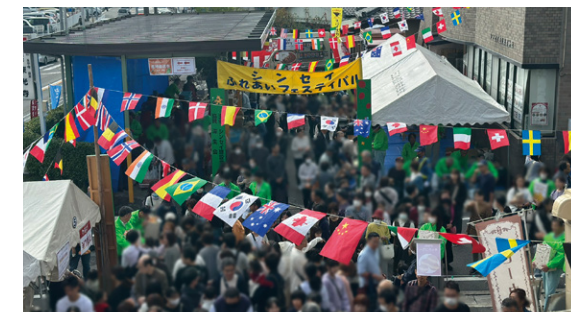
ふれあいフェスティバル