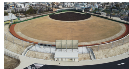
2023年完成 大府市発注 大府市民球場