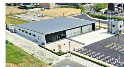
2020年完成 大府市発注 共長出張所および防災