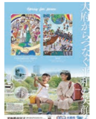
▲シティプロモーションポスター