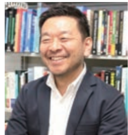
風間孝さん (中京大学教授) 7/8(土) 10:00 『性的少数者の人権』