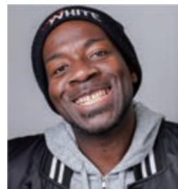
星野ルネさん (漫画家・タレント) 6/24(土) 10:00 『多様性を楽しむ』