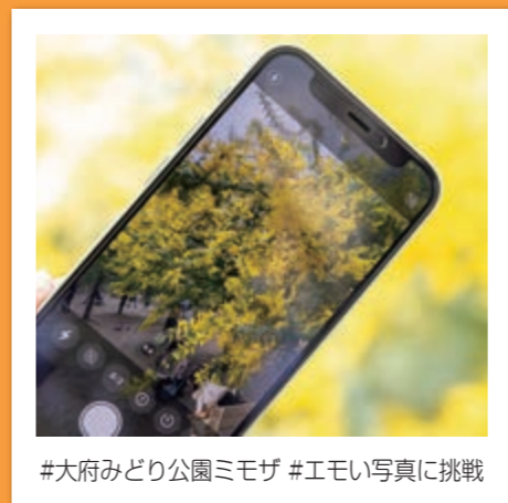
#大府みどり公園ミモザ #エモい写真に挑戦