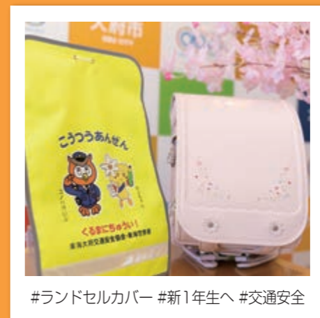
#ランドセルカバー #新1年生へ #交通安全