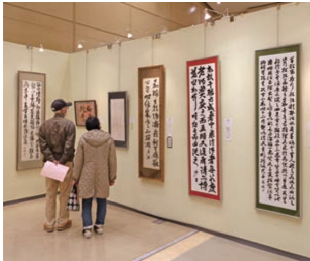
▲235点の作品が展示されました