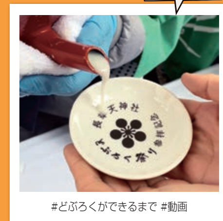
#どぶろくができるまで #動画