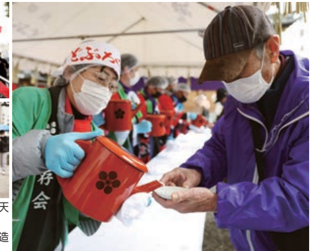
▲どぶろくの振る舞いを受ける参拝客