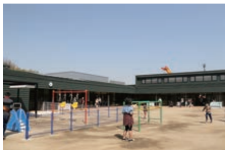
▲完成した新「吉田保育園」の園舎と園庭

新「吉田保育園」の完成に伴い、竣工式と内覧会を行いました。旧吉田保育園(築49年)と米田保育園(築48年)では、多くの園児を保育してきましたが、園舎の老朽化に伴い、2つの園を1つに統合し、新園舎を建設しました。新「吉田保育園」では一時的保育事業を実施し、地域の子育て拠点としての機能も備えるほか、食育の観点から、園児がガラス窓から調理室や下処理室をのぞくことができる工夫がなされています。