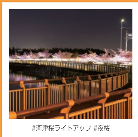
#河津桜ライトアップ #夜桜