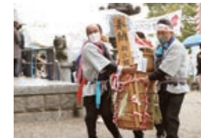
上 多くの人でにぎわう長草天神社 下 今年は向江組がどぶろく造りを担当