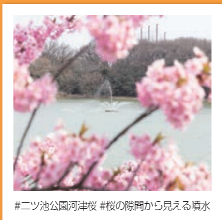
#二ツ池公園河津桜 #桜の隙間から見える噴水