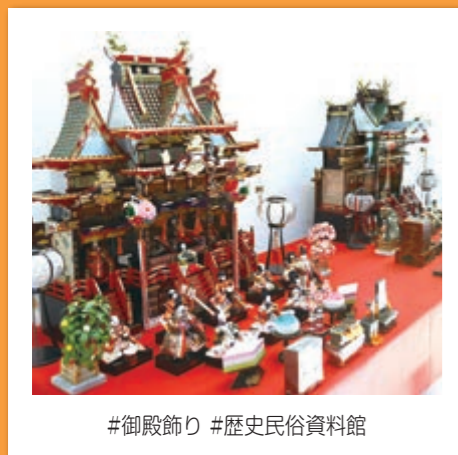
#御殿飾り #歴史民俗資料館