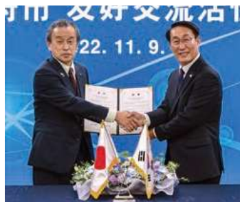
▲友好交流活性化協約を締結した岡村市長とイ・ヨンロク洪城郡守

令和5(2023)年7月には、友好交流活性化協約に基づく初の事業となる「大府市・洪城郡青少年交流事業」を実施し、大府市の高校生を洪城郡のK-POP高校に派遣しました。