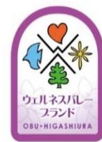
ブランドロゴマーク