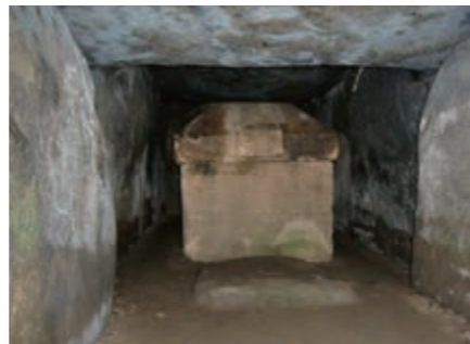
▲大きな石棺が残る埴塚古墳(奈良県桜井市)

日本の古墳の場合、宮内庁に管理されているものなど一部を除き、自由に見学ができ、石室まで入れるものもあります。ウルルを守る先住民と同じように、古墳の被葬者や造った人たちの思いに配慮して古墳に入ることを遠慮すべきかもしれませんが、好奇心を抑えられず、つい入ってしまいます。内部を見学することで、今では知られざる被葬者らが想像の中でよみがえります。このように忘れられた人に思いを寄せることもある意味の「配慮」かもしれません。