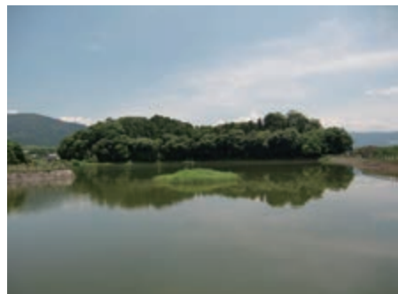
▲卑弥呼の墓という説もある箸墓古墳(奈良県桜井市)