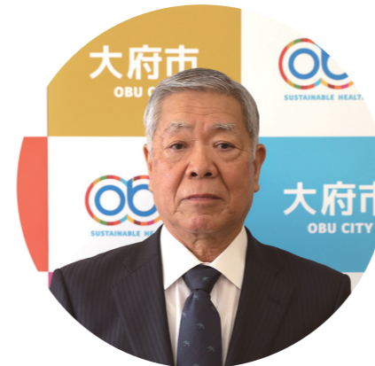
瑞宝双光章(警察功労)