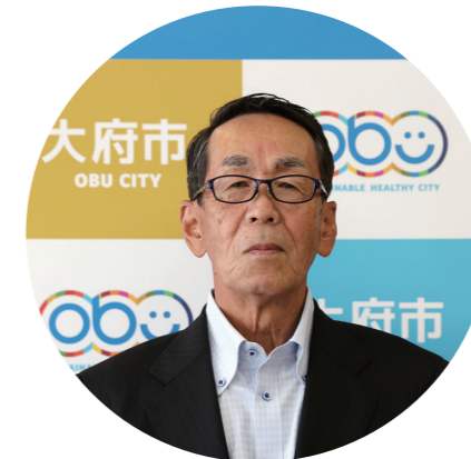
瑞宝単光章(消防功労)