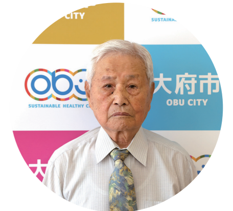
瑞宝双光章(労働行政事務功労)