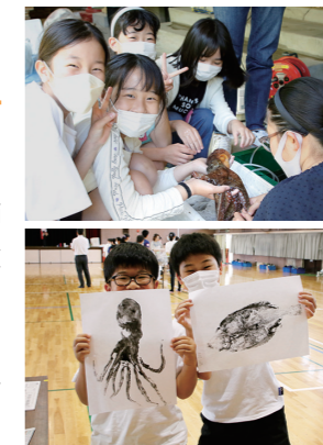
上 新鮮な魚を観察しました 下 タコとカレイの魚拓を取りました

お魚タッチのコーナーでは、アンコウやタコなど、普段あまり触れる機会のない魚を実際に手に取り、目の大きさや口の中、ひれの形などを、じっくりと観察しました。小学生は、水産に興味を持つだけでなく、SDGsの視点から海や陸の豊かさを守るためにできることを考えました。