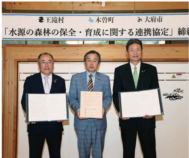
▲左から越原王滝村長、岡村市長、原木曾町長