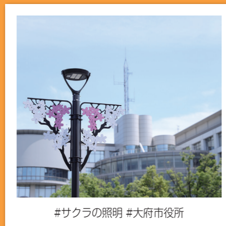
#サクラの照明 #大府市役所