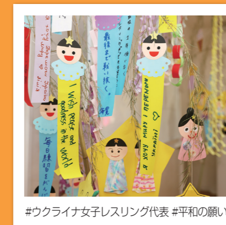
#ウクライナ女子レスリング代表 #平和の願い