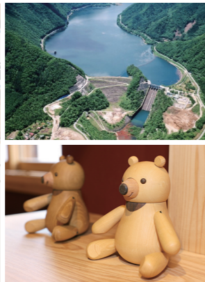
上 牧尾ダム 下 木曾おもちゃ美術館内の木製のクマの人形