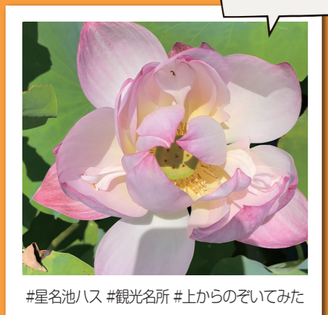
#星名池ハス #観光名所 #上からのぞいてみた