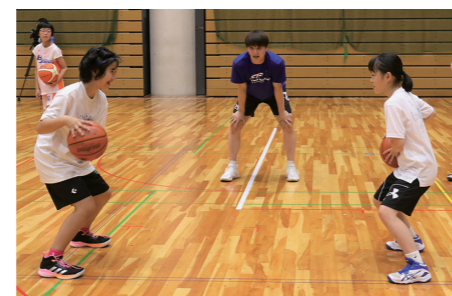
▲ドリブルを教わる参加者ら

メディアス体育館おおぶで、ファイティングイーグルス名古屋の選手から学ぶ、バスケットボール教室を開催しました。市内の小学4～6年生約60人が参加し、瞬発力・判断力を養うトレーニングや、ドリブル・パス・シュートについて指導を受けました。