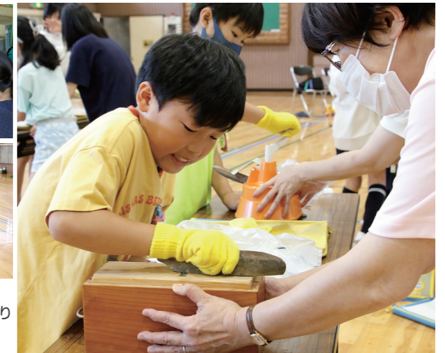
▲2種類のかつお節削り器の違いを比べています