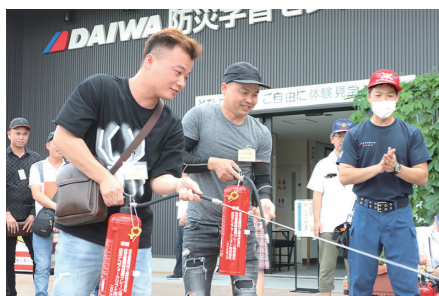
▲消火器を使用した消火体験

DAIWA防災学習センターで、外国人のための防災講座を開催しました。参加者は、消火器の取扱講座で、火元を見つけたときには大きな声で周囲に伝えた後、消火器の栓を「ピン」と抜き、「ポン」とホースを固定部から外して火元に向け、「パン」とレバー