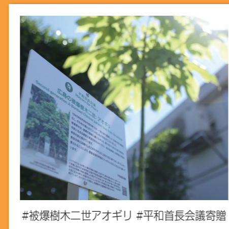
#被爆樹木二世アオギリ #平和首長会議寄贈