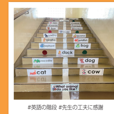
#英語の階段 #先生の工夫に感謝