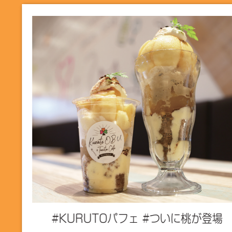
#KURUTOパフェ #ついに桃が登場

大府のいいところを発見したら、「#ファインダー越しの大府の世界」でどんどん投稿してね！