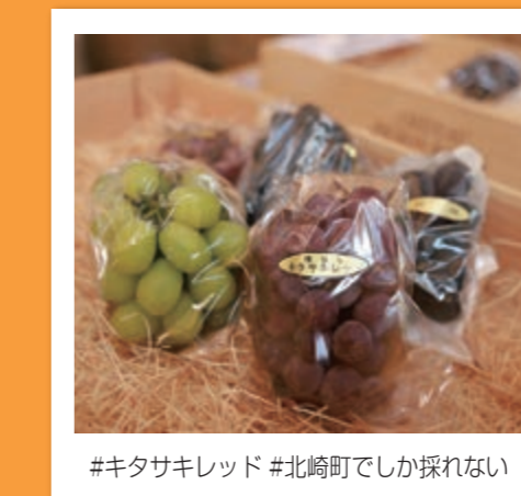
#キタサキレッド #北崎町でしか採れない