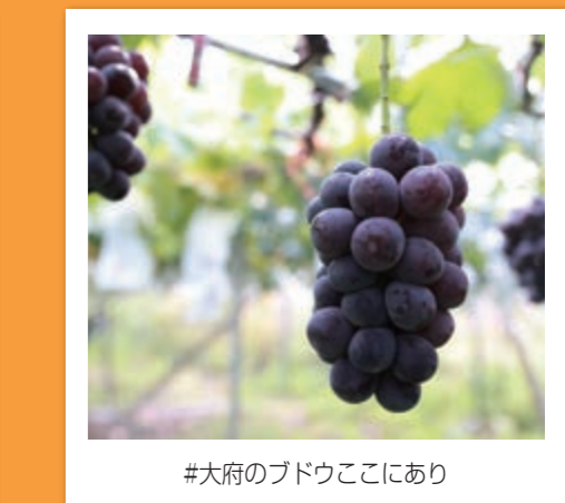
#大府のブドウここにあり

大府のいいところを発見したら、「#ファインダー越しの大府の世界」でどんどん投稿してね！ 健康都市おおぶの魅力をたっぷり発信中♡