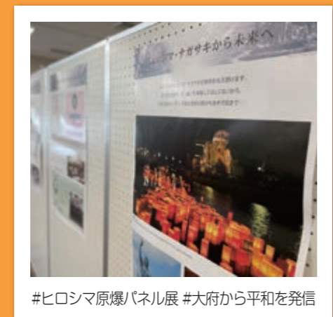
#ヒロシマ原爆パネル展 #大府から平和を発信