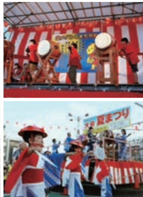
上 市内中学生委員会とOBによる和太鼓演奏(共長夏まつり) 下 大府ばやし・小唄保存会による踊り(大府夏まつり)