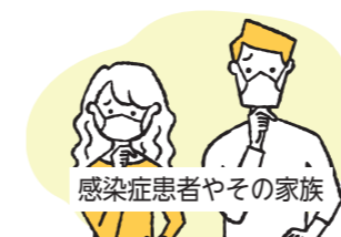
感染症患者やその家族

新型コロナウイルス感染症をはじめとする各種感染症の対策の強化を図ることにより、市民の皆さまの生命と健康を守り、生活や経済に及ぼす影響を最小限にするため、令和2年10月1日に条例を施行しました。条例には、感染症拡大防止のための市・市民・事業者の責務や、市の推進する施策、差別的な取り扱いや誹謗中傷の禁止、風評被害の防止などを定めています。