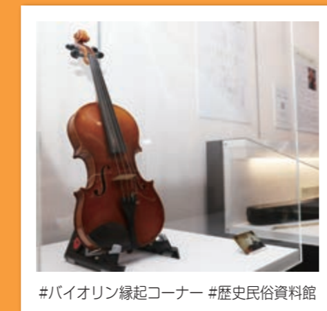
#バイオリン縁起コーナー #歴史民俗資料館