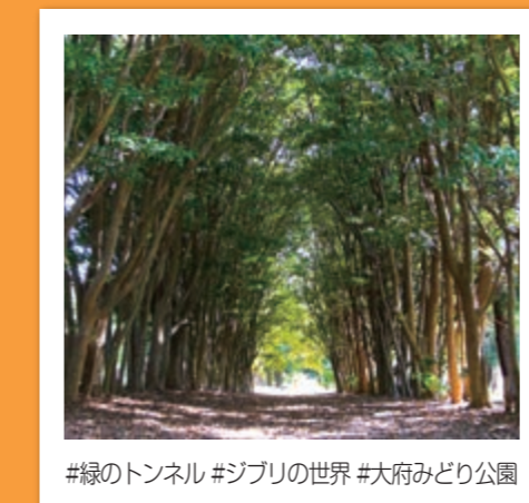
#緑のトンネル #ジブリの世界 #大府みどり公園