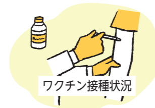
ワクチン接種状況