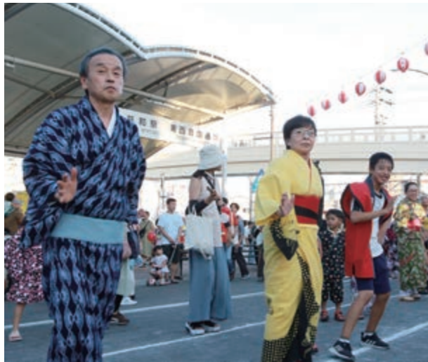
▲「ダンシングヒーロー」を踊る岡村市長(共長夏まつり)