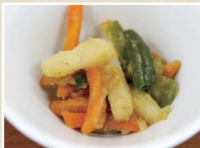
甘辛な味付けで、弁当のおかずにもピッタリです。