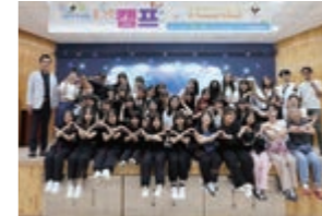
上 伝統服を着て記念撮影。 タイムスリップした気分 下 最後はみんなで記念撮影