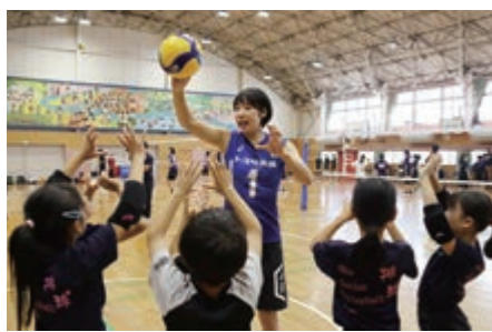
▲トスを教わる参加者

市内の小・中学生約60人が参加し、ストレッチやウォーミングアップの後、レシーブやアタックについて指導を受けました。