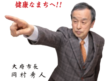
大府市長 岡村 秀人