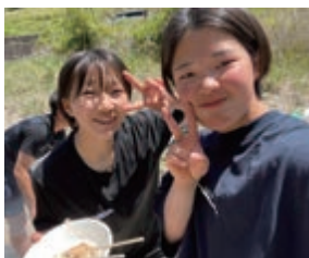
▲チームメートとのオフショット(左)

今後は、「先輩たちを全力でサポートし、自分も成長してチームの一員として活躍できるよう頑張りたいです」と努力を続けます。