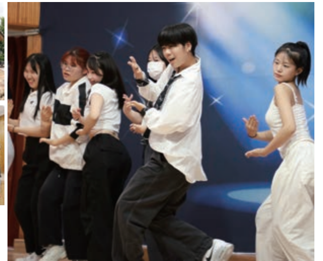
▲ステージでキレイのあるダンスを披露する生徒