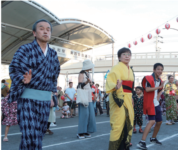
▲「ダンシングヒーロー」を踊る岡村市長(共長夏まつり)