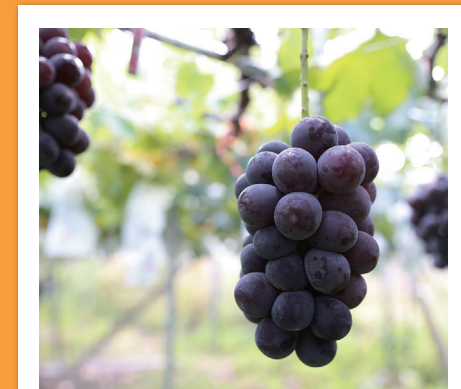
#大府のブドウここにあり

大府のいいところを発見したら、「#ファインダー越しの大府の世界」でどんどん投稿してね！