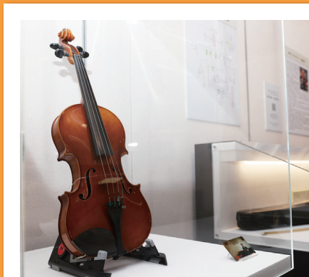
#バイオリン縁起コーナー #歴史民俗資料館