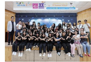
上 伝統服を着て記念撮影。タイムスリップした気分 下 最後はみんなで記念撮影