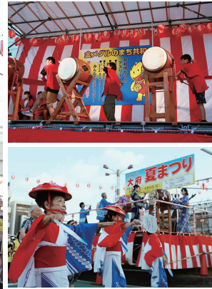
上 市内中学生委員会とOBIによる和太鼓演奏(共長夏まつり) 下 大府ばやし・小唄保存会による踊り(大府夏まつり)