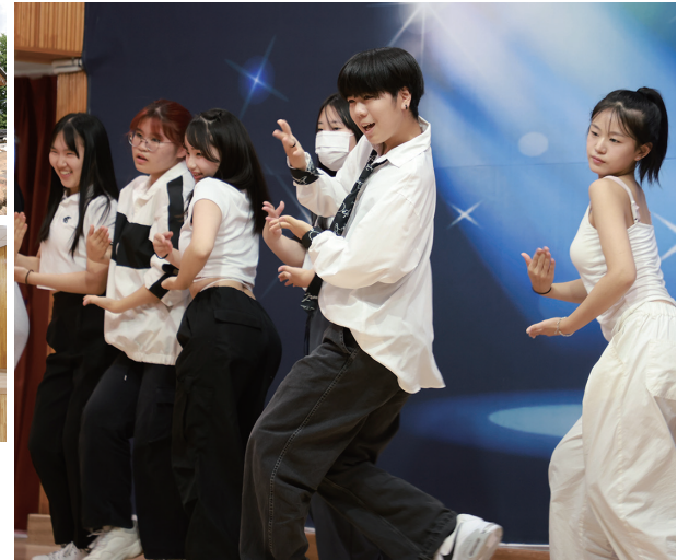
▲ステージでキレのあるダンスを披露する生徒