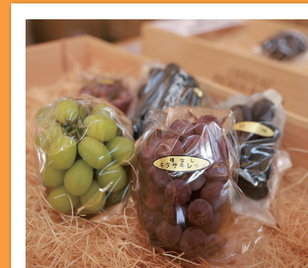
#キササキレッド #北崎町でしか採れない