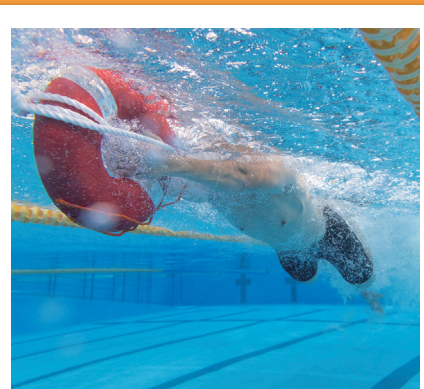
#消防職員 #消防救助技術を競う全国大会出場