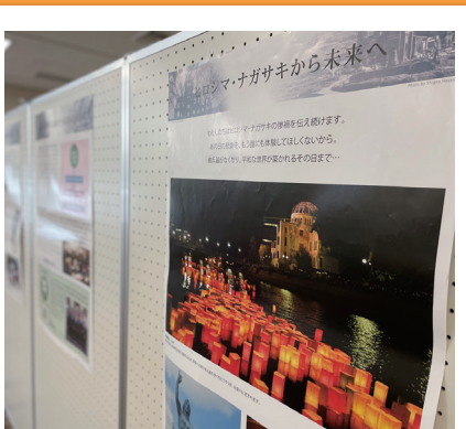
#ヒロシマ原爆パネル展 #大府から平和を発信